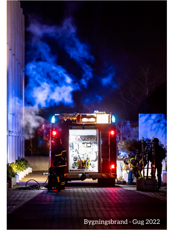
Bygningsbrand - Gug 2022