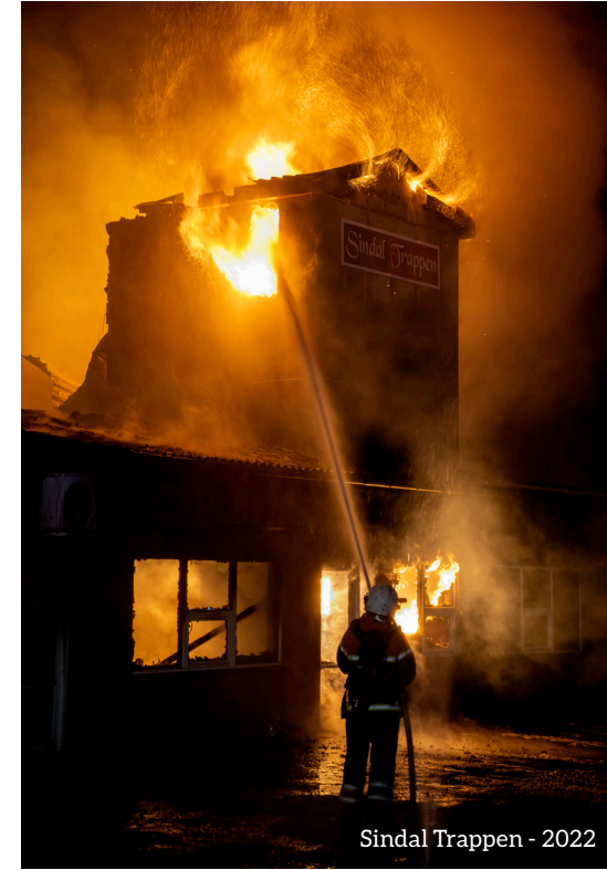
Sindal Trappen - 2022