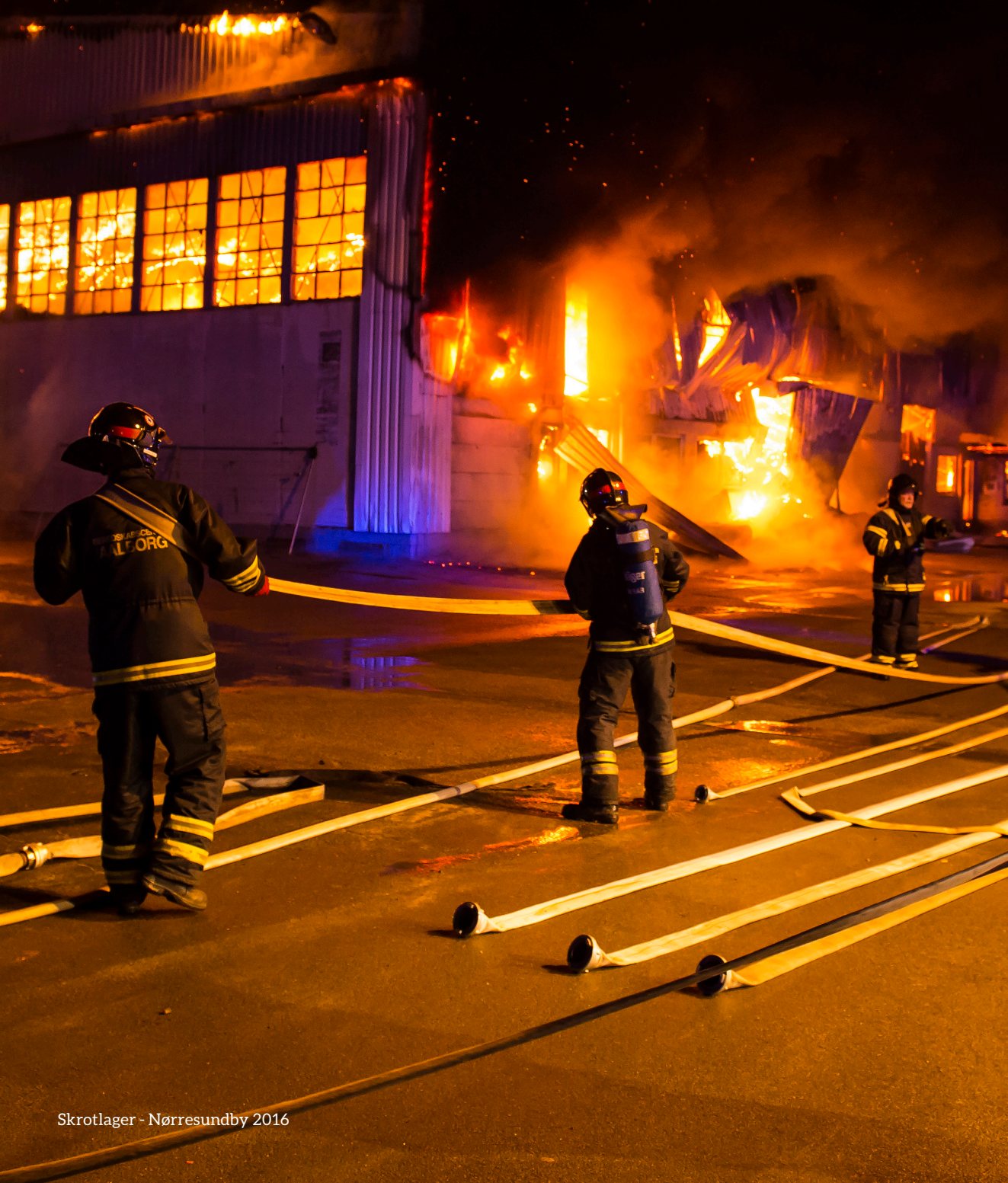
Skrotlager - Nørresundby 2016