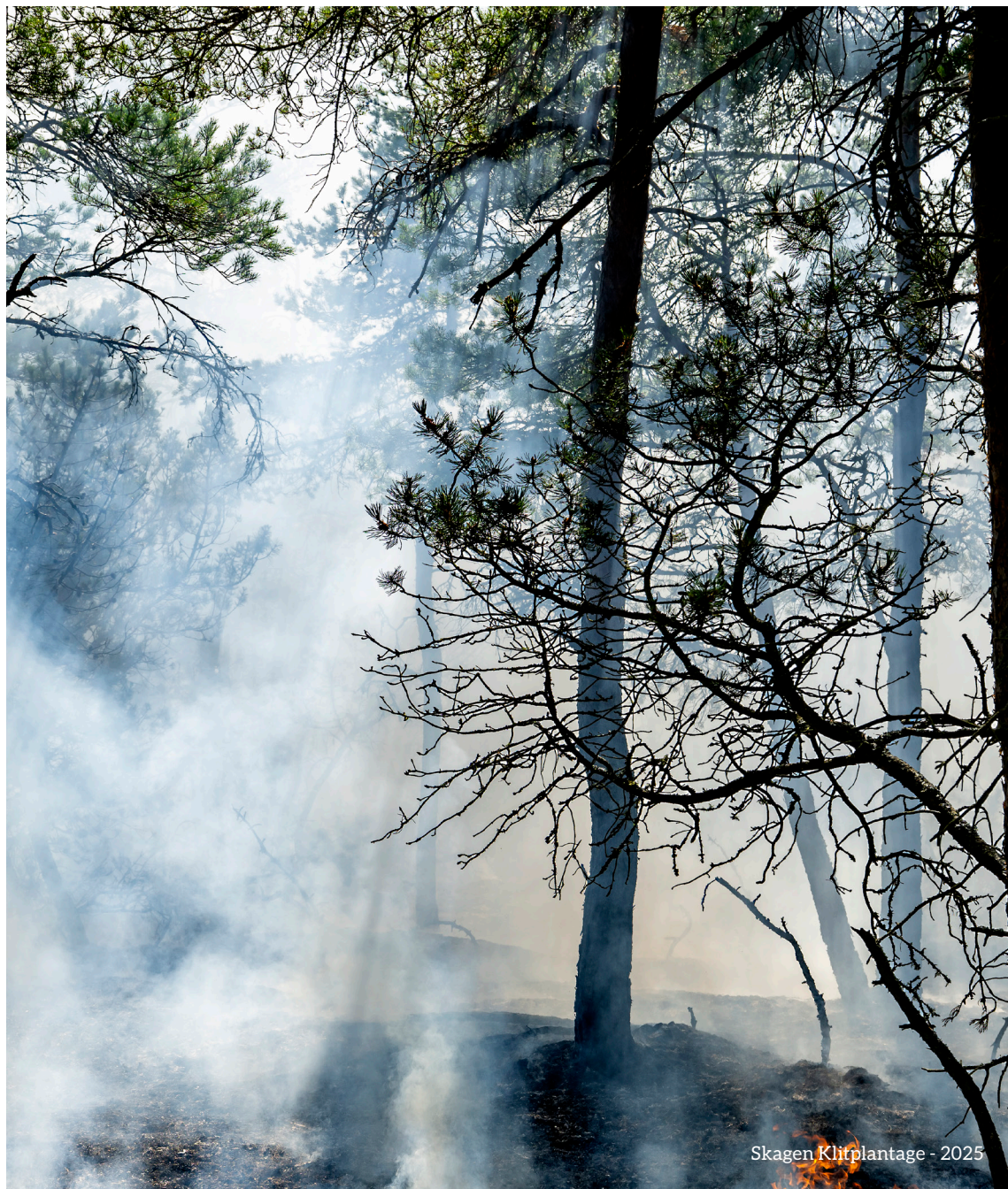
Skagen Klitplantage - 2025