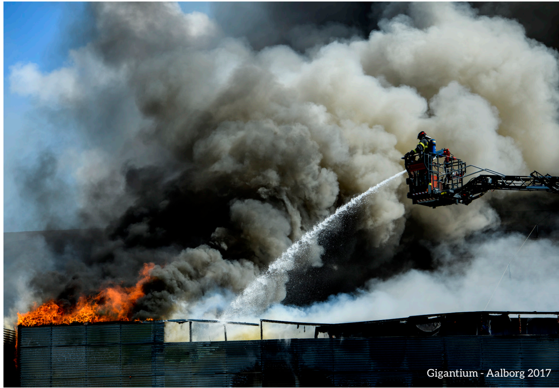
Gigantium - Aalborg 2017