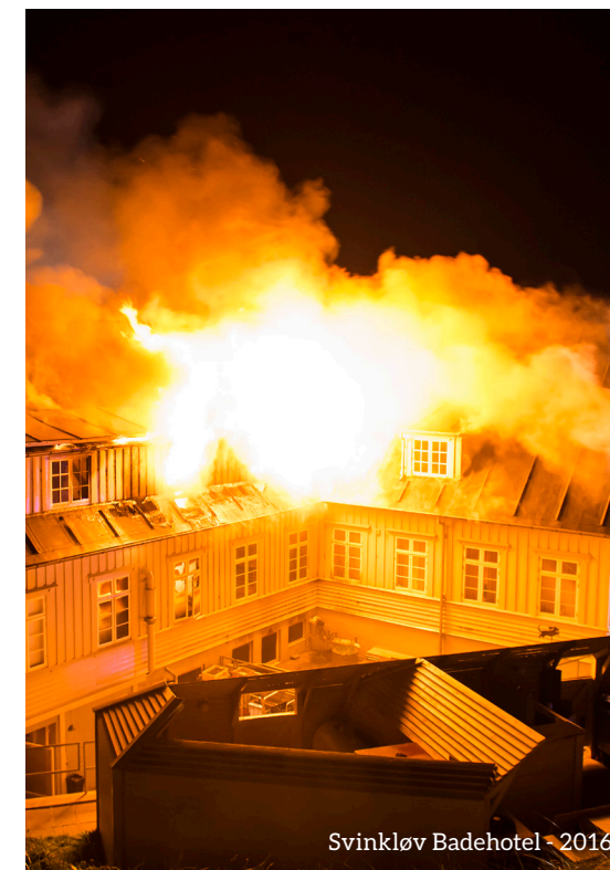
Svinkløv Badehotel - 2016

April Baggrundrapport udarbejdes af arbejdsgruppe med repræsentation fra alle kommuner