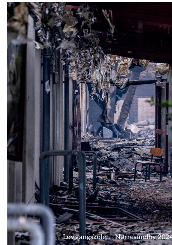
Løvvangskolen - Nørresundby 2024

April Godkendelse af Den Operative Dimensioneringsplan