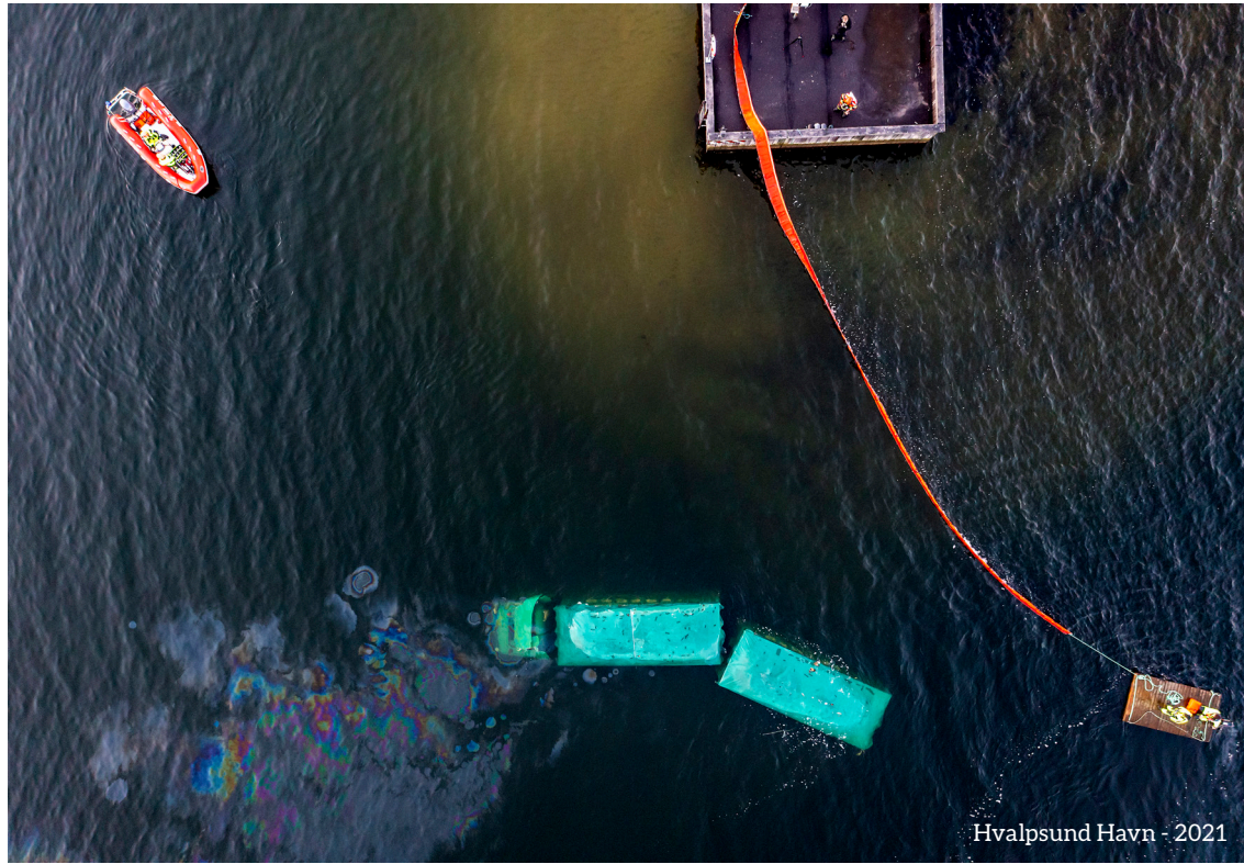
Hvalpsund Havn - 2021