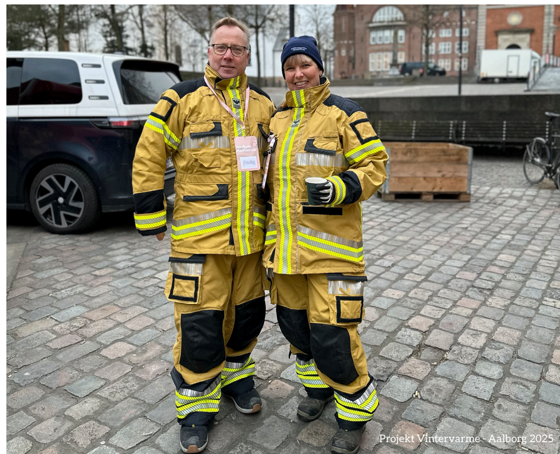
Projekt Vintervarme - Aalborg 2025

Nordjyllands Beredskab er ikke kun en arbejdsplads - det er et fællesskab. Her deles erfaringer, her støtter man hinanden, og her skabes en kultur, hvor alle bidrager til et fælles mål: at redde liv og skabe tryghed. Denne kultur er en styrke, som ingen teknologi kan erstatte. Vores værdier: Ordentlighed, Faglighed og Vi gør en forskel lever i den grad op til, og vores nyligt gennemførte undersøgelser af trivsel og fastholdelse bekræfter fællesskabsånden og det stærke beredskabs-DNA.