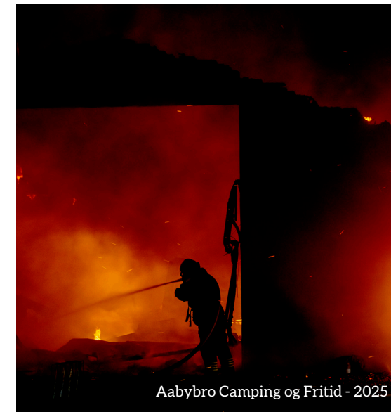
Aabybro Camping og Fritid - 2025

Januar Brand på færøsk fragtskib i Hirtshals