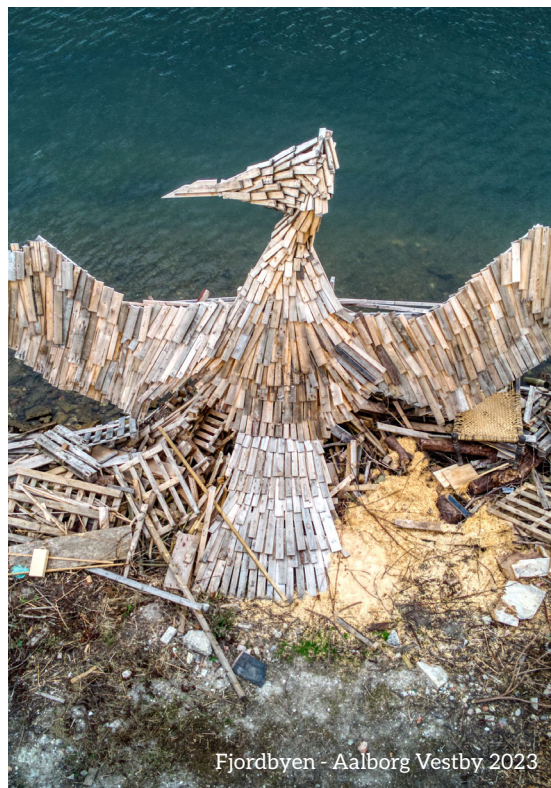
Fjordbyen - Aalborg Vestby 2023