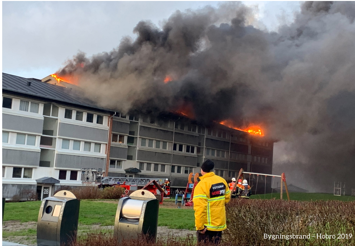
Bygningsbrand - Hobro 2019