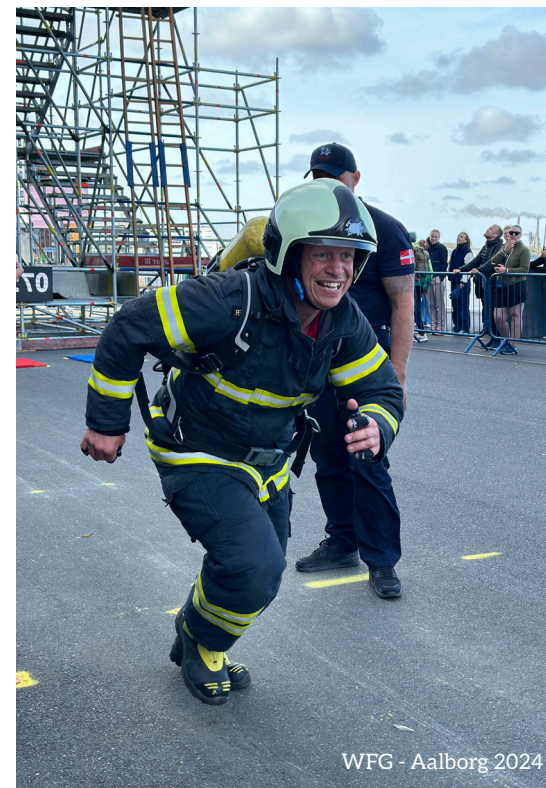
WFG - Aalborg 2024