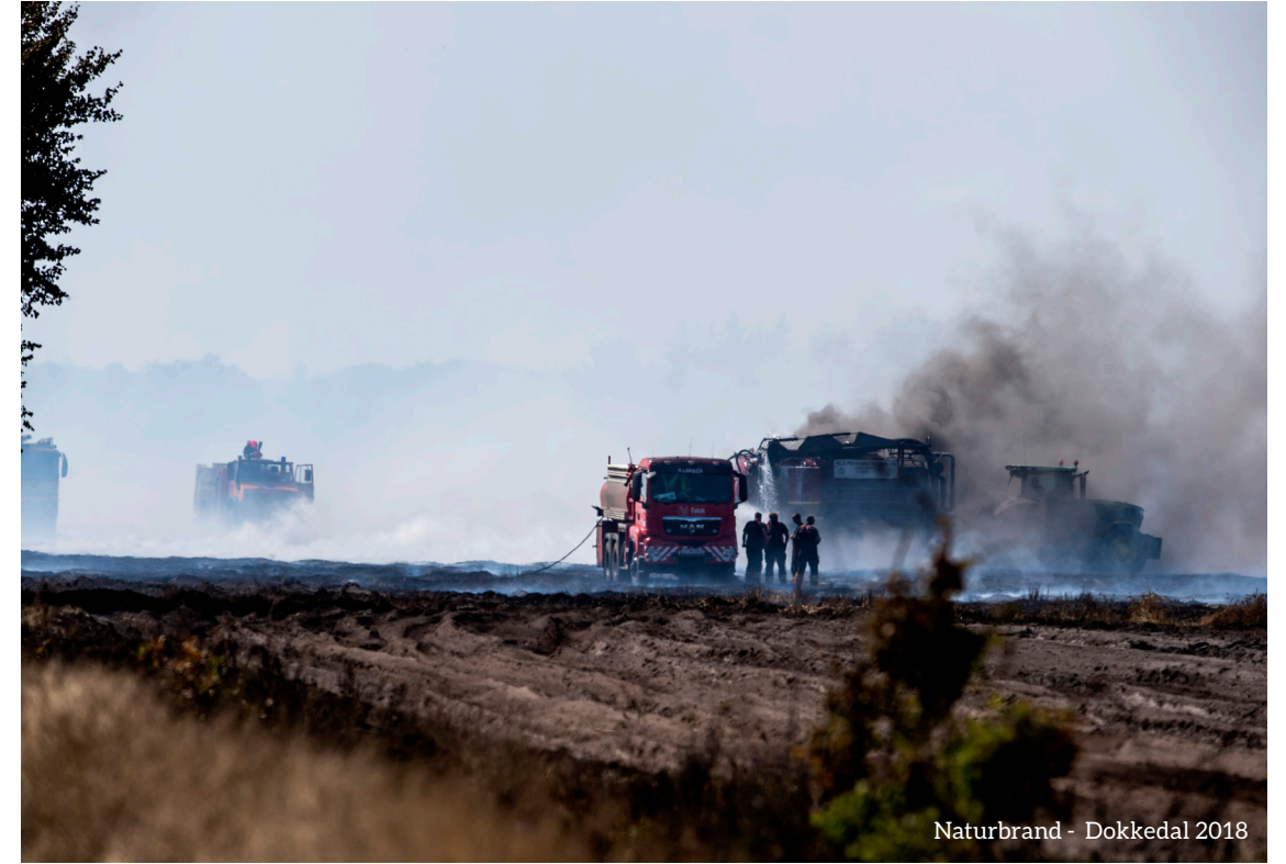
Naturbrand - Dokkedal 2018