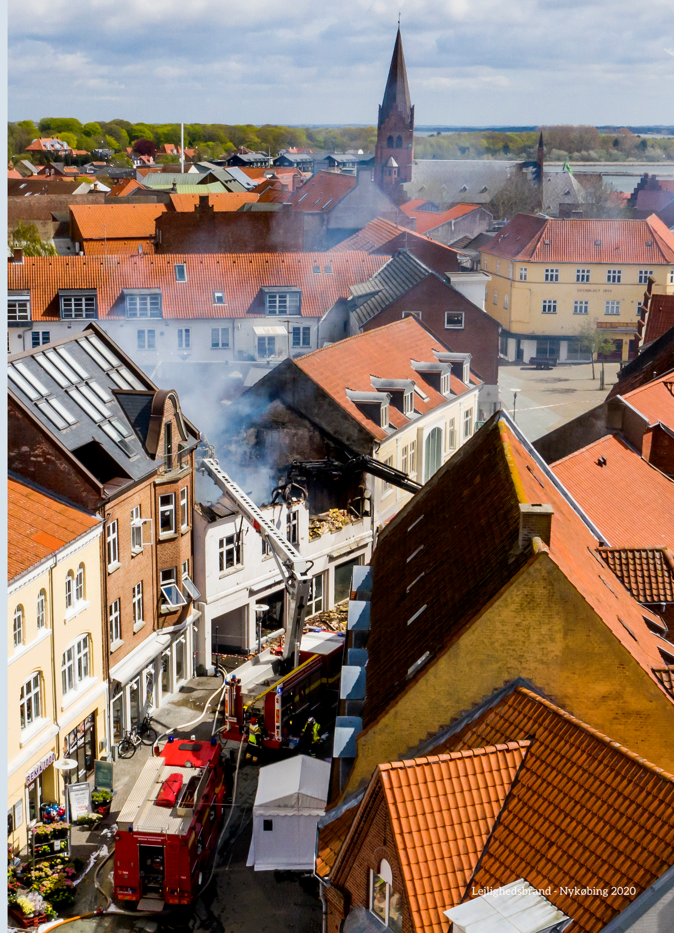
Leilighedsbrand - Nykøbing 2020