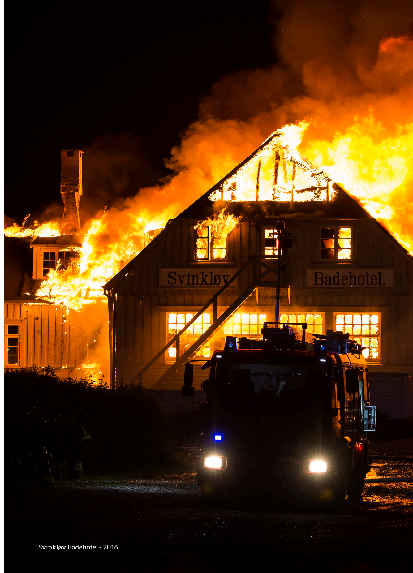
Svinkløv Badehotel - 2016

Fordelene ved at være én stor enhed, frem for mange mindre, er tydelige. Vi har opnået et stærkt fagligt miljø, bedre mulighed for specialisering, effektiv ressourceudnyttelse og koordinering på tværs samt øget robusthed og fleksibilitet i indsatser. Samtidig har vi skabt en mere ensartet service og opnået stordriftsfordele i både indkøb, uddannelse og drift.