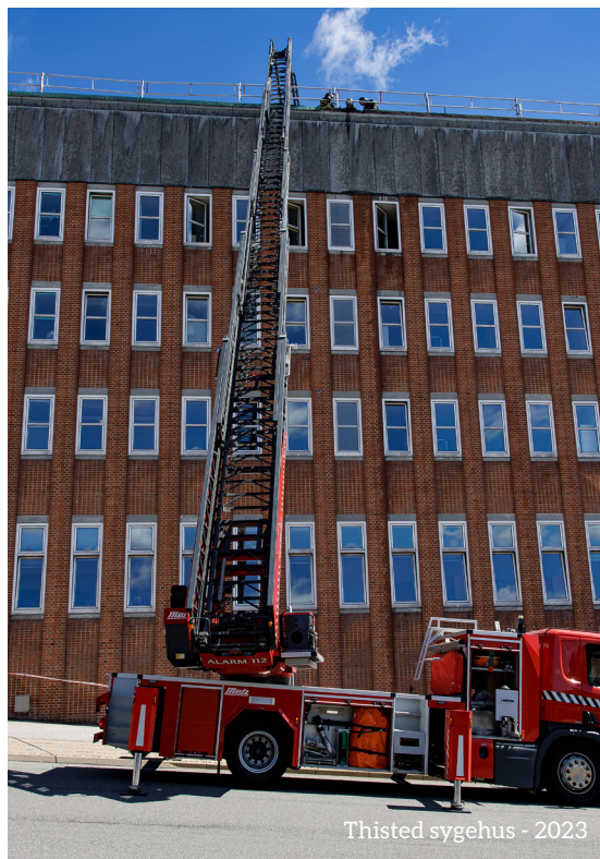
Thisted sygehus - 2023