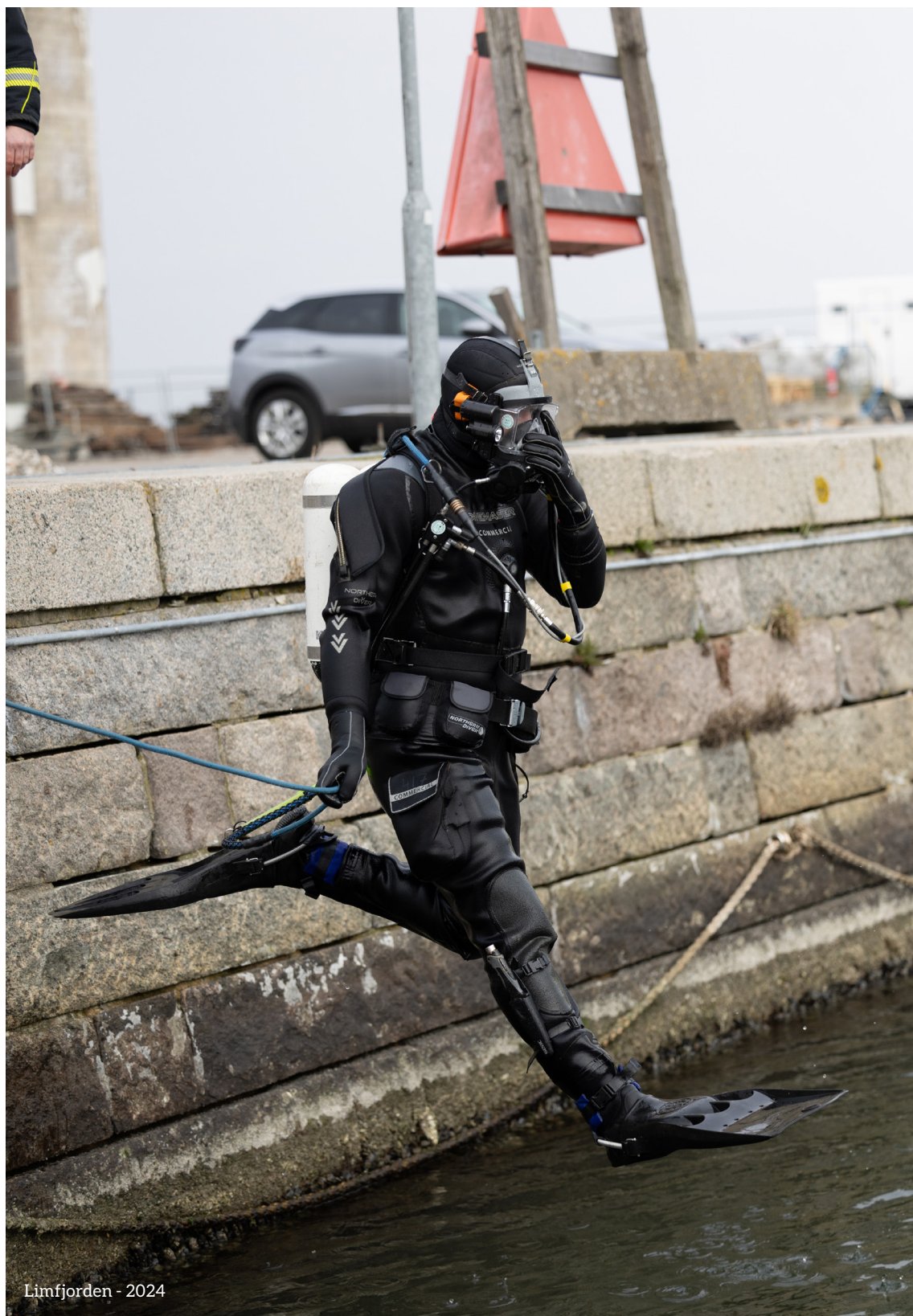
Limfjorden - 2024