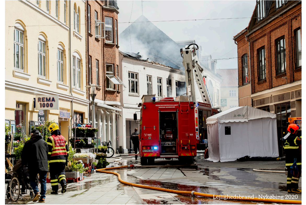
Lejlighedsbrand - Nykøbing 2020