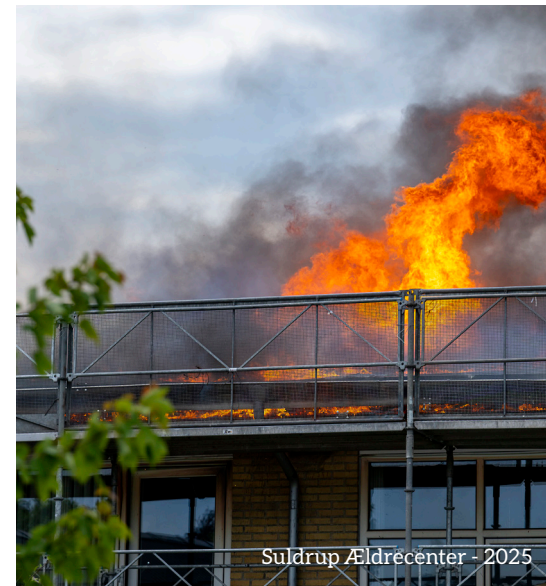
Suldrup Ældrecenter - 2025