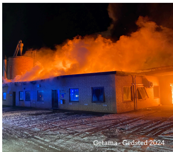
Getama - Gedsted 2024